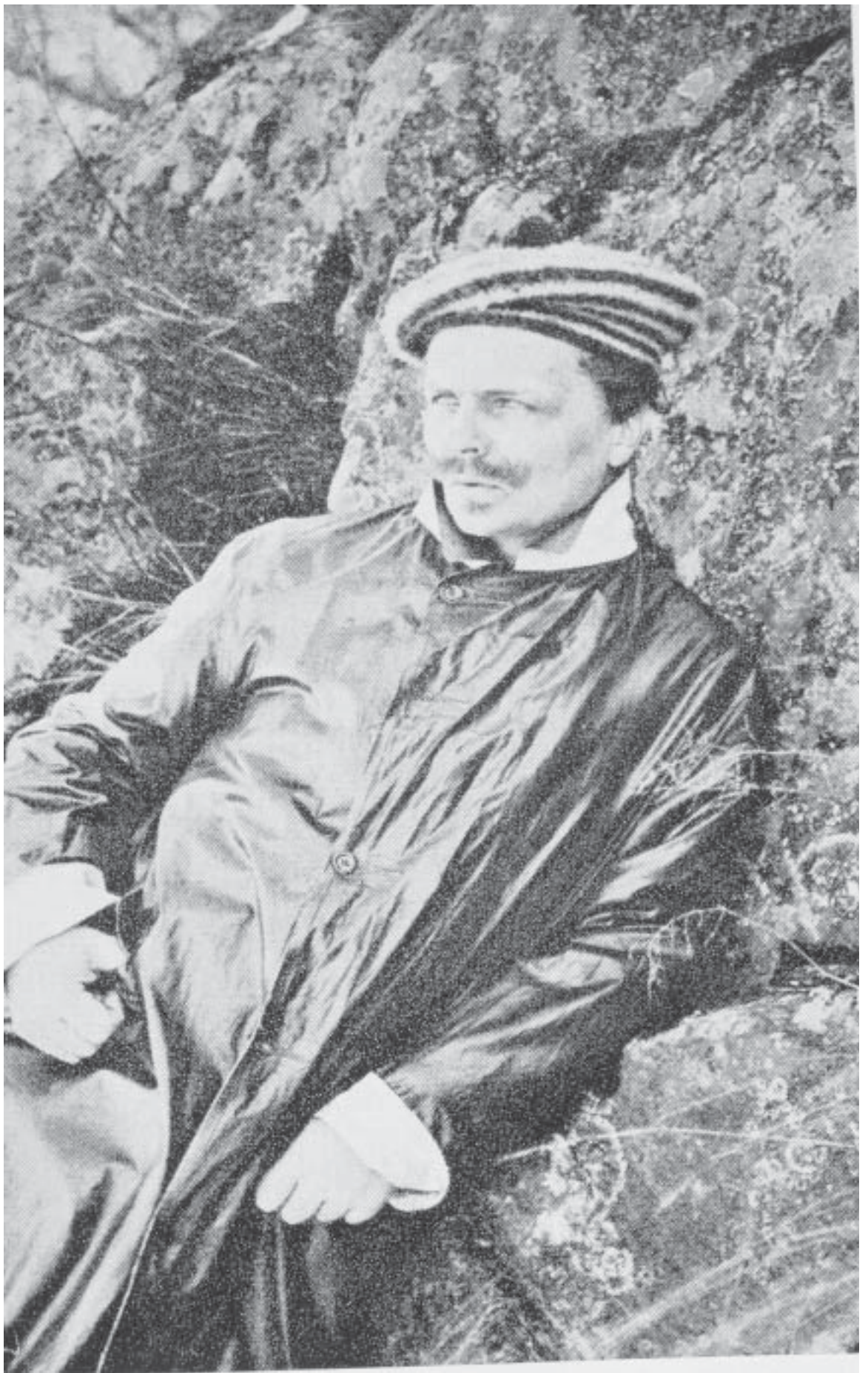
August Srinberg vid tidpunkten för skilsmässan från Siri von Essen.